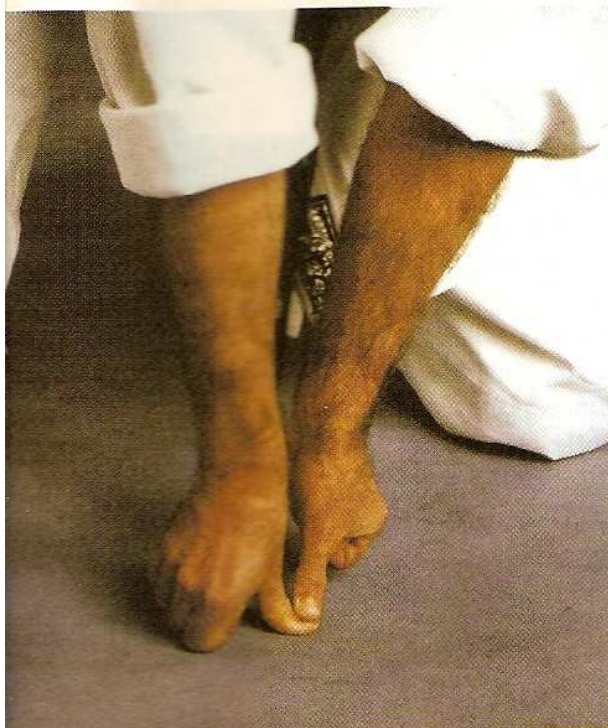
L'une des spécificités du shiatsu est d'utiliser plus particulièrement les pouces pour les pressions.

qui traversent et activent le corps humain. Des pressions digitales, exercées plus particulièrement avec les pouces, sont appliquées sur les tsubos (points énergétiques utilisés en Shiatsu) situés le long des méridiens. Elles vont avoir un effet de dispersion en allégeant les Kyo (les trop pleins) ou un effet de stimulation en remplissant les Jitsu (les vides) afin de rééquilibrer le corps physique, psychique et